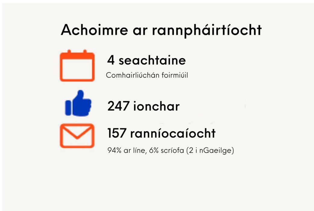
Figiúr ES-1: Achoimre rannpháirtíochta

Chun feasacht a mhúscailt, rinneadh breis is 33,000 bileog a sheachadadh chuig breis is 9,000 maoin laistigh den limistéar comhairliúcháin (féach Aguisín I do mhiondealú na gceantar). Cuireadh eolas suas chun dáta ar fáil don phobal ar shuíomh idirlín thionscadal an ospidéil agus trí chainéal ríomhphoist tiomnaithe.